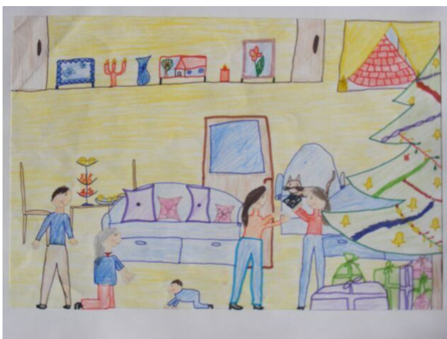
Hunyadvári Laura: Együtt ünnepelünk 2. helyezés